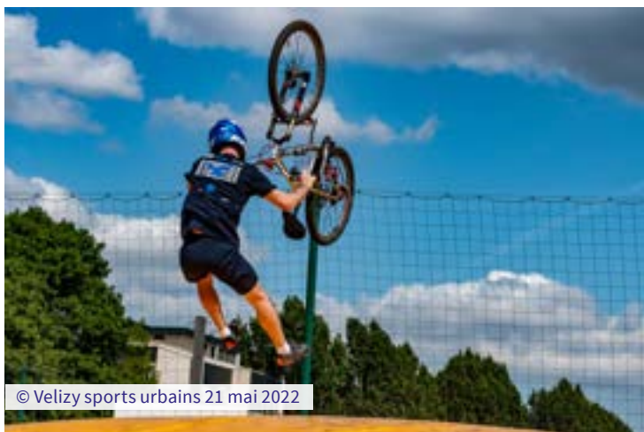
© Velizy sports urbains 21 mai 2022

À la demande et en collaboration avec la Médiathèque, le responsable de la jeunesse et sept photographes du Club-Photo ont participé à cette manifestation pour prendre des clichés qui seront exposés en grand format au Skatepark.