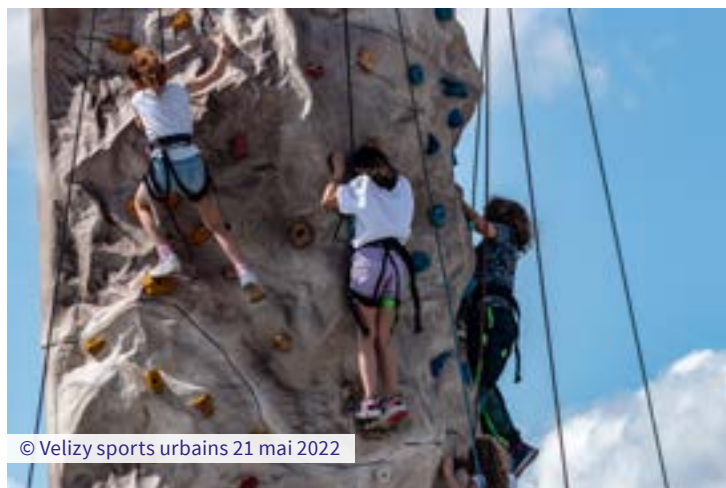
© Velizy sports urbains 21 mai 2022