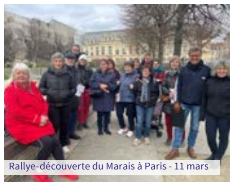
Rallye-découverte du Marais à Paris - 11 mars

Nous leur proposons de réaliser un petit film, un clip, d'environ trois minutes, pour faire découvrir leur quartier. Ils laisseront libre court à leur imagination. À nous renvoyer à : contact@mozartstreet.fr avant le 10 mai 2023. Ces films seront présentés sur notre stand, le 14 mai prochain. Les trois meilleurs seront primés avec des récompenses pour leurs auteurs.