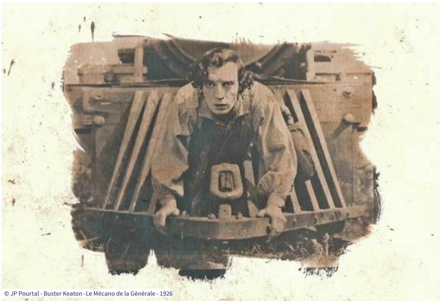
© JP Pourtal - Buster Keaton - Le Mécano de la Générale - 1926